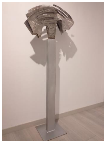
Neurodiferencia 170 cm x 50 cm x 65 cm Aceiro inoxidable manuscrito