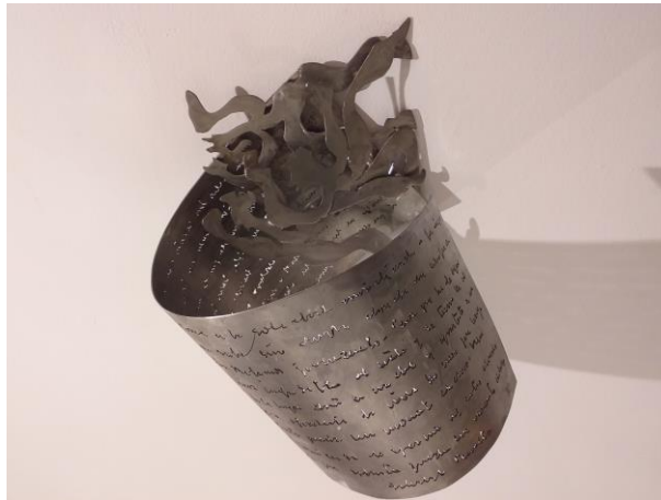
Expectativa aprazada 43 cm x 26 cm x 38 cm Aceiro inoxidable manuscrito