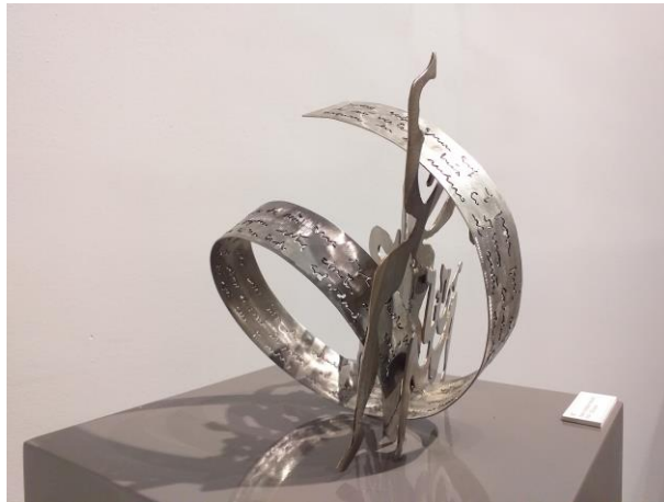
S/T 180 cm x 10 cm x 360 cm