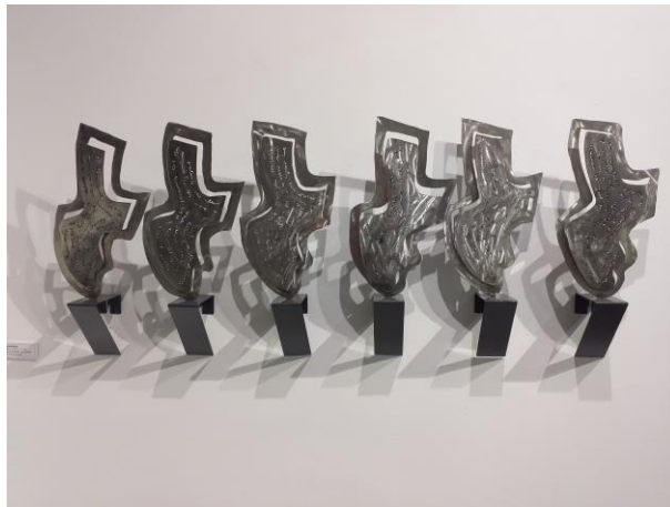
Singularidade 35 cm x 10 cm x 17 cm Aceiro inoxidable manuscrito