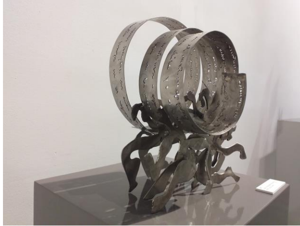
S/T Aceiro inoxidable manuscrito