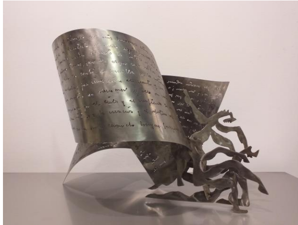
Aperta a forma das emocións 35 cm x 30 cm x 65 cm Aceiro inoxidable manuscrito