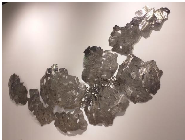
O camiño ao horizonte 180 cm x 10 cm x 360 cm Aceiro inoxidable manuscrito