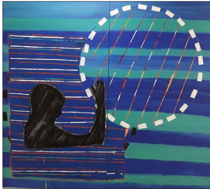
Muller do círculo

"Hay que transmitir la mirada de las mujeres, la sensibilidad que construye el binomio arte - mujer, seguimos en la lucha por la superación del llamado techo de cristal"